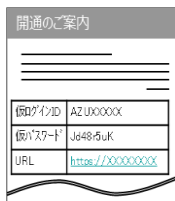
あずけ〜る開通のご案内

あずけ〜るの開通ご案内と「MS Office Online on あずけ〜る」の重要事項説明を送付します。