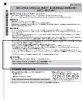
「MS Office Online on あずけ〜る」の重要事項説明

▼フレッツ・あずけ〜る申し込み時にメールアドレスをご登録いただければ、ご登録いただいたメールアドレスに対して「MS Office Online on あずけ〜るご利用開始」をお知らせいたします。